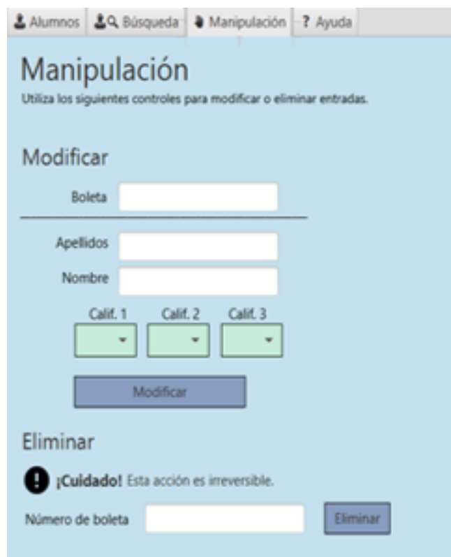
Figura 3 Apartado Manipulación.

Y, por último, pero no menos importante se encuentra la interfaz del apartado Ayuda (Figura 4), en donde se observan datos de contacto con el servicio técnico del programa.