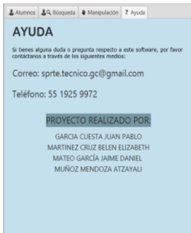
Figura 4 Apartado Ayuda.