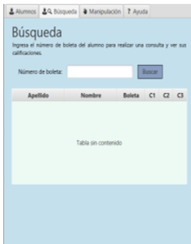
Figura 2 Apartado Búsqueda.

La tercera interfaz que el usuario puede observar es el apartado de Manipulación (Figura 3), en donde se muestra: